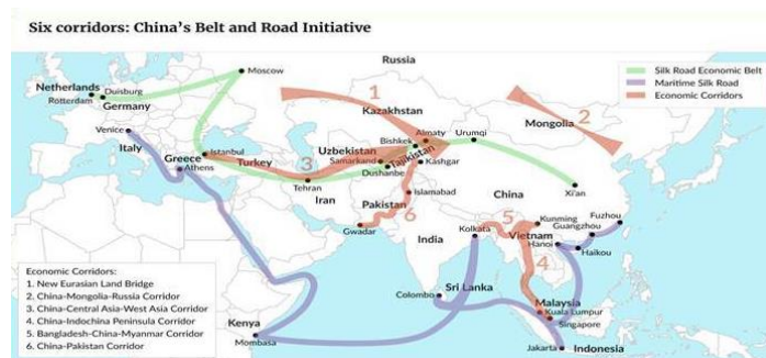
รูปภาพ 1: Six corridors: China's Belt and Road Initiative

ข้อริเริ่มหนึ่งแถบหนึ่งเส้นทางเป็นยุทธศาสตร์ว่าด้วยการร่วมสร้างแนวความร่วมมือทางเศรษฐกิจตามประเทศแถบเส้นทางสายไหมทั้งทางบกและทางทะเลในศตวรรษที่ 21 โดยประธานาธิบดีสี จิ้นผิงได้กล่าวข้อริเริ่มนโยบายเส้นทางสายไหมทางบกในขณะที่ไปเยือนเอเชียกลางในปี ค.ศ. 2013 ต่อมาในปี ค.ศ. 2015 ได้กล่าวเส้นทางสายไหมทางทะเลในศตวรรษที่ 21 ในขณะที่ได้เยือนประเทศอินโดนีเซีย ซึ่งทั้งสองเส้นทางนี้เปรียบเสมือนสะพานที่เชื่อมโยงยุโรป แอฟริกาเหนือ เอเชียใต้ เอเชียกลาง เอเชียตะวันออกเฉียงใต้ เอเชียตะวันตกผ่านการสร้างโครงสร้างพื้นฐานและระเบียงเศรษฐกิจเข้าด้วยกัน ซึ่งนับว่าเป็นโครงการก่อสร้างโครงสร้างพื้นฐานของโลกที่ประเทศจีนจะมีส่วนช่วยในการพัฒนาเศรษฐกิจของประเทศตามแถบนโยบาย จึงทำให้นโยบายดังกล่าวถูกยกระดับเป็นนโยบายระดับชาติของจีน ซึ่งมุ่งเน้นการนำไปสู่ความร่วมมือในการพัฒนาร่วมกัน โดยยึดถือความร่วมมือทางด้านเศรษฐกิจเป็นหลัก ไม่แทรกแซงทางการเมืองของประเทศอื่น ทั้งยังยึดเอาการแลกเปลี่ยนบุคลากรและวัฒนธรรมเป็นตัวหนุนที่สำคัญ เพื่อเสริมสร้างความไว้นื้อเชื่อใจกัน รวมทั้งเสริมสร้างการแลกเปลี่ยนอย่างรอบด้าน